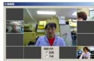
多拠点会議の画面(TV会議)

また、「MINC」に標準添付されるソフトフォン「IntelliVoiceMint Client」はTV電話機能を搭載していて、USBカメラなどを接続することで、TV電話もすぐに実現できます。離れた拠点の複数のメンバーで会議を行う場合でも、会議通話機能（※）と拠点間内線連携サービスを使うことで新たな投資がなくてもTV会議システムが完成。データなどの共有においても音声だけでコミュニケーションを図るのは意外と難しいようで『情報の伝達や意志の疎通にはフェイスtoフェイスが有効で、効率が良くなった！』と評価いただくケースが実は多く、コミュニケーションの質の向上に貢献できます。※「会議通話機能」は別途料金がかかります。詳しくはお問い合わせ下さい。